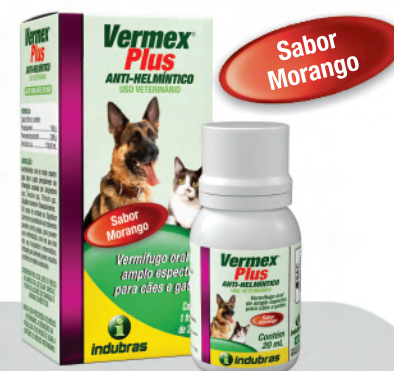
Cartucho 20 mL | Caixa com 25

E assim sucessivamente, considerando 0,5 mL para cada 1 kg.