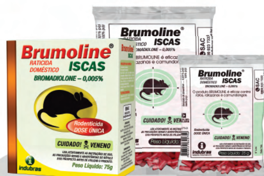
Sachê 25 g | Caixa com 200 Cartucho 75 g | Caixa com 45 Caixa econômica com 60 sachês x 75 g

Terminada a desratização, recolher as sobras.