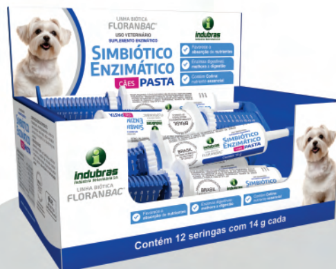
Display c/ 12 seringas com 14 g | Caixa com 5 (60)