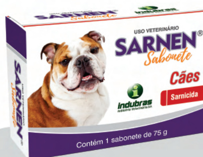
Cartucho 75 g | Caixa com 24