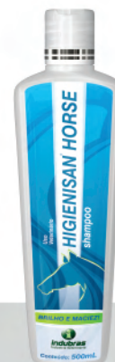
Frasco 500 mL | Caixa com 12

Molhar o animal e aplicar o produto ao longo de seu dorso, massageando bem o pelo e enxaguar. Repetir a aplicação, deixando a espuma agir por alguns minutos, obtendo assim brilho intenso. Enxaguar bem.