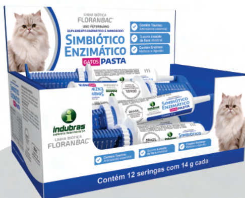
Display c/ 12 seringas com 14 g | Caixa com 5 (60)