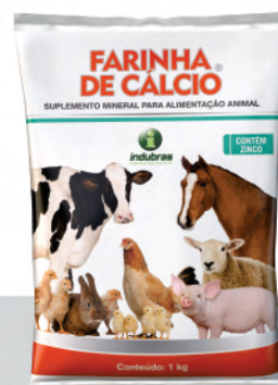
Sachê 1 kg | Caixa com 10

* O consumo do produto deverá ser calculado com base no valor mínimo da faixa de consumo recomendada.