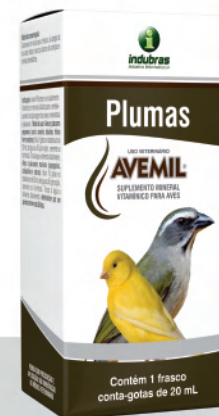
Cartucho c/ Frasco 20 mL | Caixa com 25

Aves e pássaros maiores (papagaio, calopsita e outros): diluir 10 gotas no bebedouro de 50 mL de água ou 50 g de ração, semente ou farinhada. Trocar a água e alimento diariamente. Administrar por um período mínimo de 30 dias.