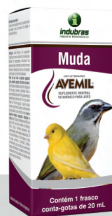
Cartucho c/ Frasco 20 mL | Caixa com 25

Aves e pássaros maiores (papagaio, calopsita e outros): diluir 20 gotas no bebedouro de 50 mL de água ou 50 g de ração, semente ou farinhada. Para suplementação coletiva destas espécies, diluir 20 mL de Avemil® Muda em 1 L de água ou 1 kg de ração, semente ou farinhada. Administrar por um período mínimo de 30 dias durante a muda, podendo ser utilizado antes ou após esse processo. Trocar a água e alimento diariamente.