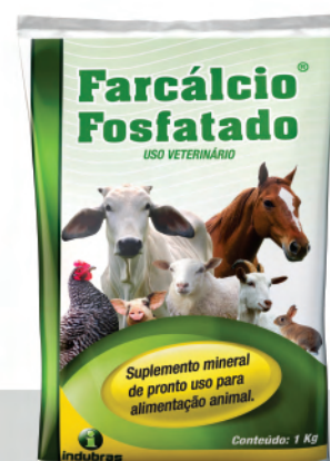
Sachê 1 kg | Caixa com 10

* O consumo do produto deverá ser calculado com base no valor mínimo da faixa de consumo recomendada.