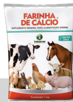
Sachê 1 kg | Caixa com 10

* O consumo do produto deverá ser calculado com base no valor mínimo da faixa de consumo recomendada.