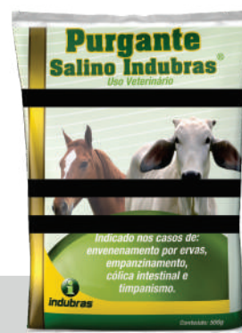
Sachê 500 g | Caixa com 15