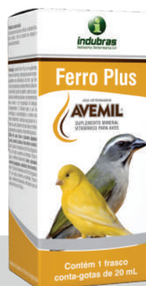
Cartucho c/ Frasco 20 mL | Caixa com 25

Aves e pássaros pequenos (curió, canário, bicudo, trinca ferro e outros): diluir 5 gotas no bebedouro de 50 mL de água ou 50 g de ração, semente ou farinhada. Trocar a água e alimento diariamente. Aves e pássaros maiores (papagaio, calopsita e outros): diluir 10 gotas no bebedouro de 50 mL de água ou 50 g de ração, semente ou farinhada. Trocar a água e alimento diariamente. Administrar por um período mínimo de 10 dias.