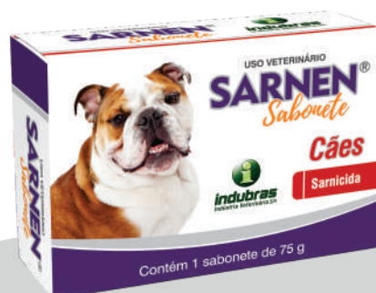
Cartucho 75 g | Caixa com 24