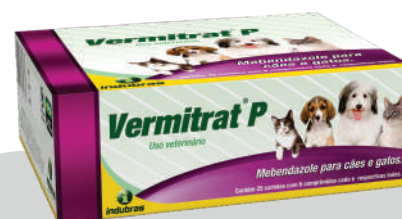
Display c/ 25 cartuchos x 6 comp. Caixa com 4 (150)