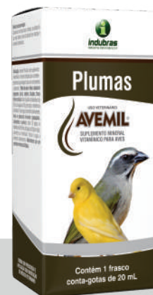
Cartucho c/ Frasco 20 mL | Caixa com 25

Aves e pássaros maiores (papagaio, calopsita e outros): diluir 10 gotas no bebedouro de 50 mL de água ou 50 g de ração, semente ou farinhada. Trocar a água e alimento diariamente. Administrar por um período mínimo de 30 dias.