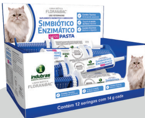
Display c/ 12 seringas com 14 g | Caixa com 5 (60)