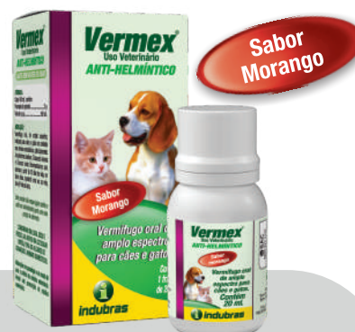
Cartucho 20 mL | Caixa com 25