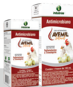
Cartucho 20 mL | Caixa com 25 Cartucho 100 mL | Caixa com 24

Não utilizar em animais produtores de ovos para consumo humano.