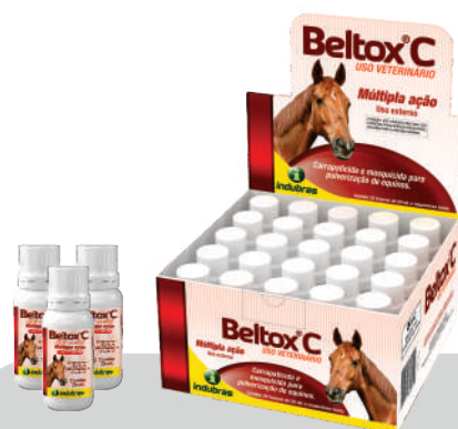
Display 25 frascos x 20 mL | Caixa com 4 (100)

Após a primeira aplicação, repetir as pulverizações com Beltox® C a cada 7 dias.