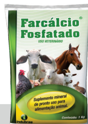
Sachê 1 kg | Caixa com 10

* O consumo do produto deverá ser calculado com base no valor mínimo da faixa de consumo recomendada.