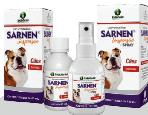
Suspensão | Cartucho 60 mL | Caixa com 24 Spray | Cartucho 120 mL | Caixa com 12