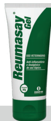
Bisnaga 80 g | Caixa com 24

Aplicar com os dedos uma pequena camada de Reumasay® Gel friccionando por alguns minutos.