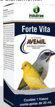
Cartucho c/ Frasco 20 mL | Caixa com 25

Aves e pássaros pequenos (curió, canário, bicudo, trinca ferro e outros): diluir 1 a 2 gotas no bebedouro de 50 mL de água ou 50 g de ração, semente ou farinhada. Trocar a água e alimento diariamente. Aves e pássaros maiores (papagaio, calopsita e outros): diluir 3 a 4 gotas no bebedouro de 50 mL de água ou 50 g de ração, semente ou farinhada. Trocar a água e alimento diariamente.