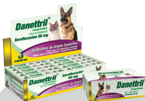
Display c/25 blísters x 10 comp. | Caixa com 4 (100) Cartucho c/10 comp. | Enro. 50 mg | Caixa com 4 (40)