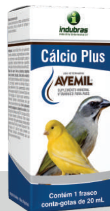
Cartucho c/ Frasco 20 mL | Caixa com 25

Aves e pássaros maiores (papagaio, calopsita e outros): diluir 30 gotas no bebedouro de 50 mL de água ou 50 g de ração, semente ou farinhada. Trocar a água e alimento diariamente. Para suplementação coletiva destas espécies, diluir 30 mL de Avemil® Cálcio Plus em 1 litro de água ou 1 quilo de ração, semente ou farinhada.