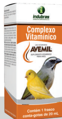
Cartucho c/ Frasco 20 mL | Caixa com 25

diariamente. Aves e pássaros maiores (papagaio, calopsita e outros): diluir 10 gotas no bebedouro de 50 mL de água ou 50 g de ração, semente ou farinhada. Trocar a água e alimento diariamente. Em casos mais severos de avitaminoses, utilizar o produto por um período mínimo de 30 dias.