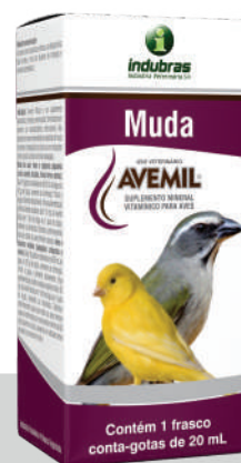
Cartucho c/ Frasco 20 mL | Caixa com 25

Aves e pássaros maiores (papagaio, calopsita e outros): diluir 20 gotas no bebedouro de 50 mL de água ou 50 g de ração, semente ou farinhada. Para suplementação coletiva destas espécies, diluir 20 mL de Avemil® Muda em 1 L de água ou 1 kg de ração, semente ou farinhada. Administrar por um período mínimo de 30 dias durante a muda, podendo ser utilizado antes ou após esse processo. Trocar a água e alimento diariamente.