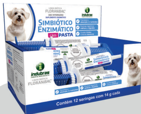
Display c/ 12 seringas com 14 g | Caixa com 5 (60)