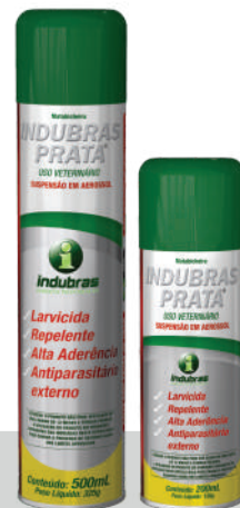
Aerossol 200 mL | Caixa com 12 Aerossol 500 mL | Caixa com 12