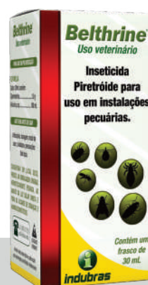
Cartucho 30 mL | Caixa com 25