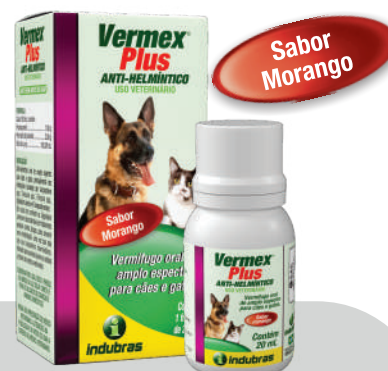
Cartucho 20 mL | Caixa com 25

E assim sucessivamente, considerando 0,5 mL para cada 1 kg.