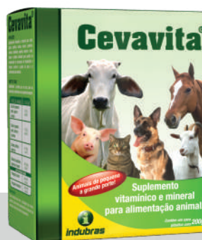
Cartucho com sachê 200 g | Caixa com 24

Obs.: Com exceção das aves, a dosagem para os demais animais pode variar de acordo com o tamanho, a critério do profissional responsável.