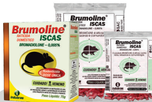
Sachê 25 g | Caixa com 200 Cartucho 75 g | Caixa com 45 Caixa econômica com 60 sachês x 75 g

Terminada a desratização, recolher as sobras.