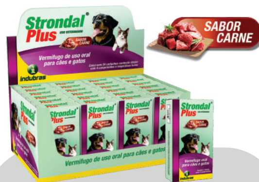
Display c/ 24 cartuchos x 4 comp. Caixa com 4 (96)